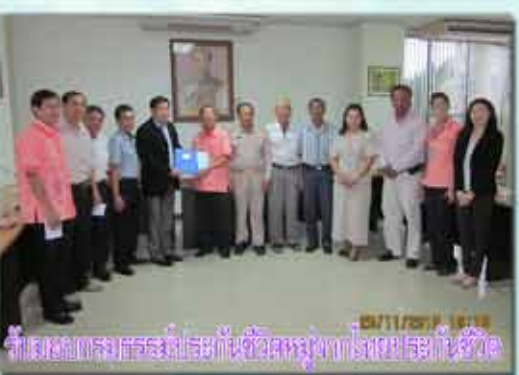
ทำเอกสารพร้อมตราประทับชื่อสหกรณ์จากโรงพิมพ์เตรียมใช้ชีวิต