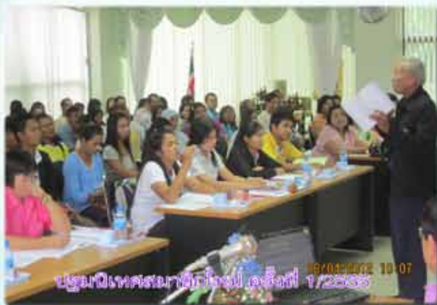
ประชุมนิเทศสมาชิกใหม่ ครั้งที่ 1/2555 09/01/2012 10:07