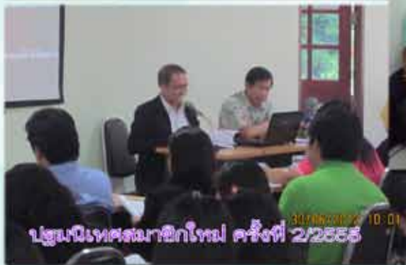
ประชุมนิเทศสมาชิกใหม่ ครั้งที่ 2/2555 30/08/2012 10:01