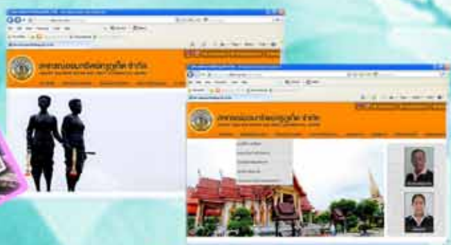
สหกรณ์พัฒนา webside ใหม่

เนื่องในโอกาสปีใหม่ 2556 ขอขอบคุณสหกรณ์ ขอส่งความสุขมายังสมาชิกสหกรณ์ทุกท่าน