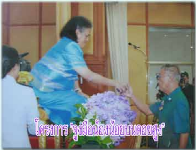
โครงการ "จูงมือน้องน้อยบนดอยสูง"