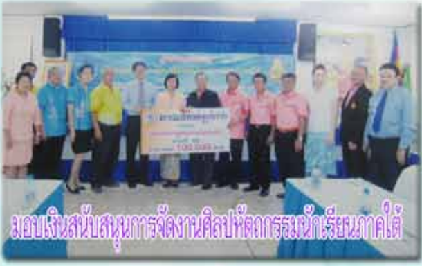
มอบเงินสนับสนุนการจัดงานศิลปหัตถกรรมนักเรียนภาคใต้