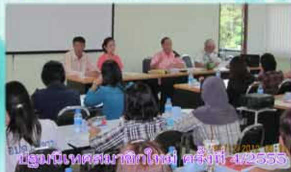
ประชุมนิเทศสมาชิกใหม่ ครั้งที่ 4/2555 01/12/2012 09:11