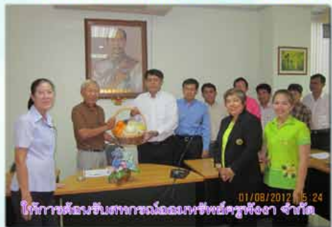
โครงการต้อนรับสหกรณ์ออมทรัพย์ครูสิงห์บุรี จำกัด