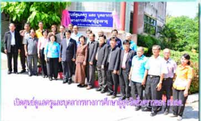
เปิดศูนย์ดูแลครูและบุคลากรทางการศึกษาผู้สูงอายุที่จังหวัดภูเก็ต