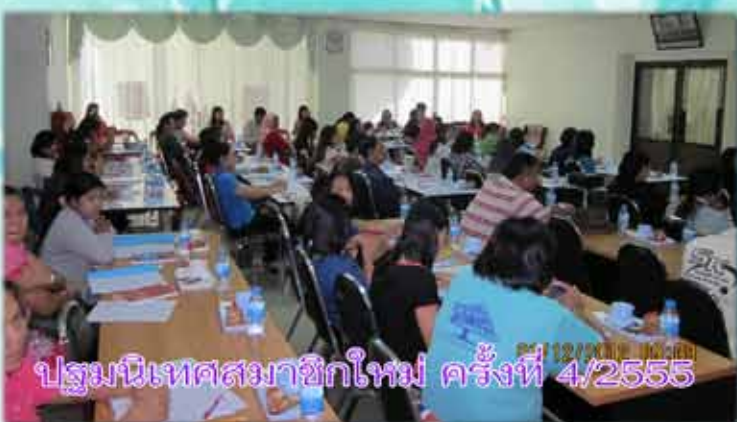
ประชุมนิเทศสมาชิกใหม่ ครั้งที่ 4/2555 01/12/2012 09:11