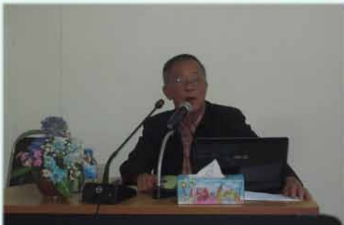
ประชุมนิเทศสมาชิกใหม่