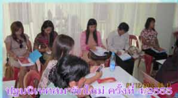
ประชุมนิเทศสมาชิกใหม่ ครั้งที่ 4/2555 01/12/2012 09:11