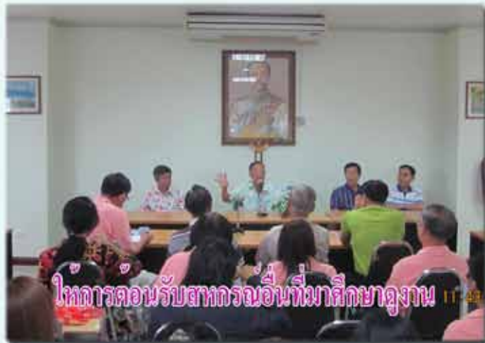
โครงการต้อนรับสหกรณ์อื่นที่มาศึกษาดูงาน