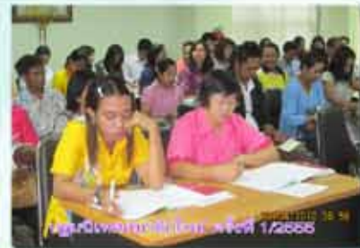
ประชุมนิเทศสมาชิกใหม่ ครั้งที่ 1/2555