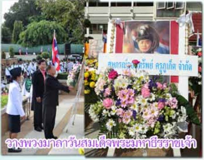
วางพวงมาลาวันสมเด็จพระมหาธีรราชเจ้า