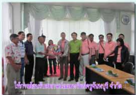
โครงการต้อนรับสหกรณ์ออมทรัพย์ครูจังหวัดจันทบุรี