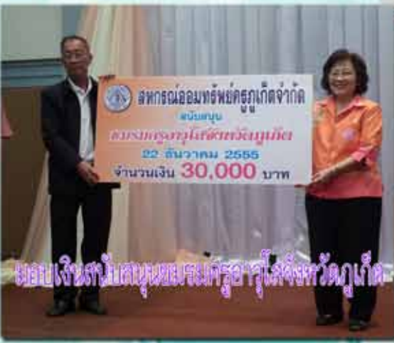
มอบเงินสนับสนุนชมรมครูอาวุโสจังหวัดภูเก็ต