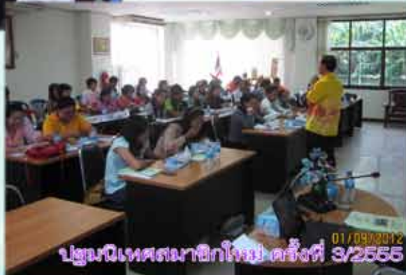
ประชุมนิเทศสมาชิกใหม่ ครั้งที่ 3/2555 01/09/2012