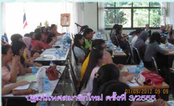
ประชุมนิเทศสมาชิกใหม่ ครั้งที่ 3/2555 01/09/2012 09:09