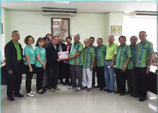
สภกรณ์อ้อมทรัพย์มหาวิทยาลัยเชียงใหม่