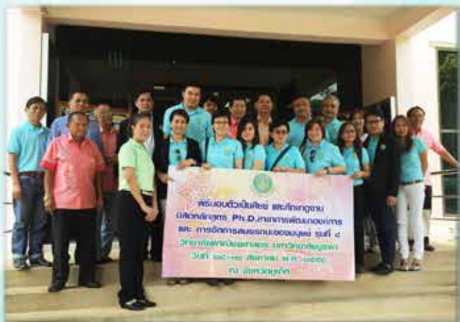
นศ.ปริญญาเอก วิทยาลัยพาณิชยศาสตร์ มหาวิทยาลัยบูรพา