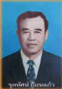
จุลทัศน์ ก้อนแก้ว