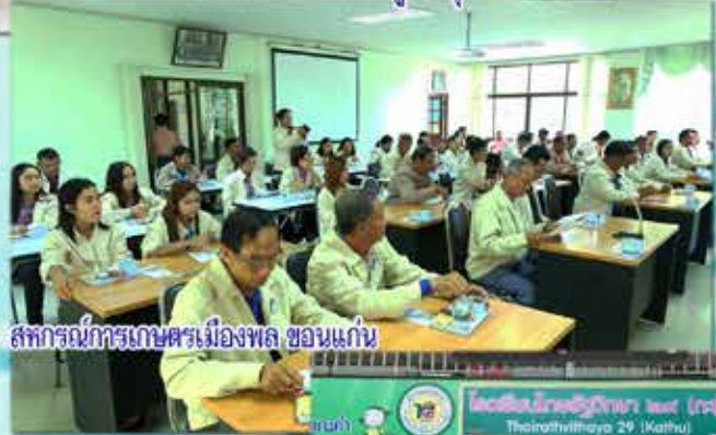
สภกรณ์การเกษตรเมืองพล ขอนแก่น