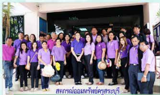
สภกรณ์อ้อมทรัพย์นครบุรี