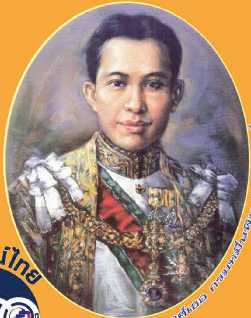
กรมทนายความหลวง