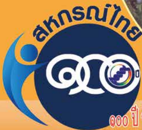
พระราชวรวงศ์เธอ กรมหมื่นพิทยาลงกรณ์

๑๐๐ ปี ร้อยดวงใจ พัฒนาสหกรณ์ไทย ให้ก้าวไกลอย่างยั่งยืน